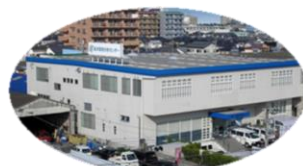
▲宮崎ラボラトリー