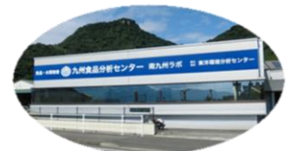
▲九州食品分析センター

営業所一覧 ・福岡営業所 ・大分営業所 ・熊本営業所 ・延岡営業所 ・宮崎営業所 ・鹿児島営業所 ・鹿屋営業所 ・出水営業所 ・奄美営業所