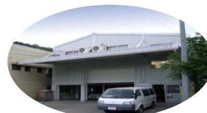
▲鹿児島ラボラトリー