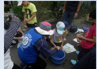
▲わくわく水生生物調査(宮崎)

■地元小学生との水生生物調査「わくわく水生生物調査」 【宮崎県日向市庄手・梶木地区】