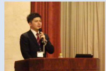
▲貯水槽清掃作業従事者研修