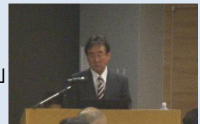
▲水道事業実務者セミナー