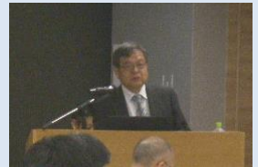
▲水道事業実務者セミナー